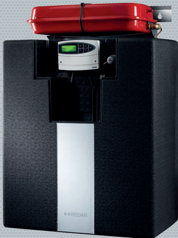
Akva Lux II VXe Fuldisoleret unit til varme og varmt vand til indirekte anlæg, til enfamilieboliger.