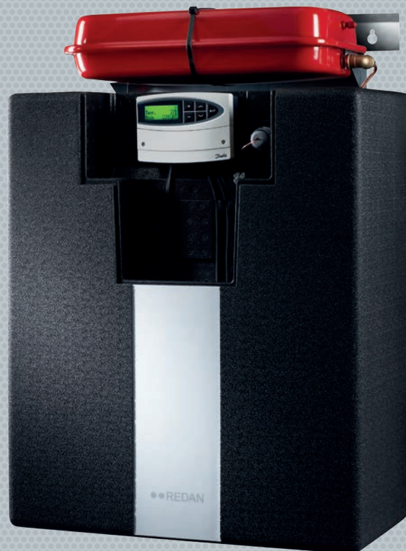
Akva Les II VXe Fuldisoleret unit til varme og varmt vand til indirekte anlæg, til enfamilieboliger, til forsyningsområder med lav fjernvarme fremløbstemperatur.