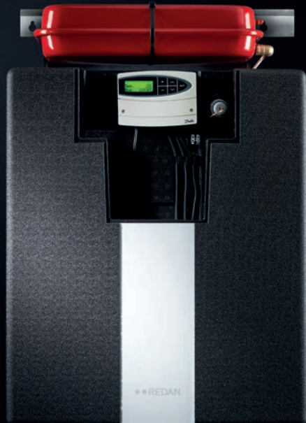
Akva Lux II VXe

Supereffektiv pladevarmeveksler baseret på nyeste teknologi