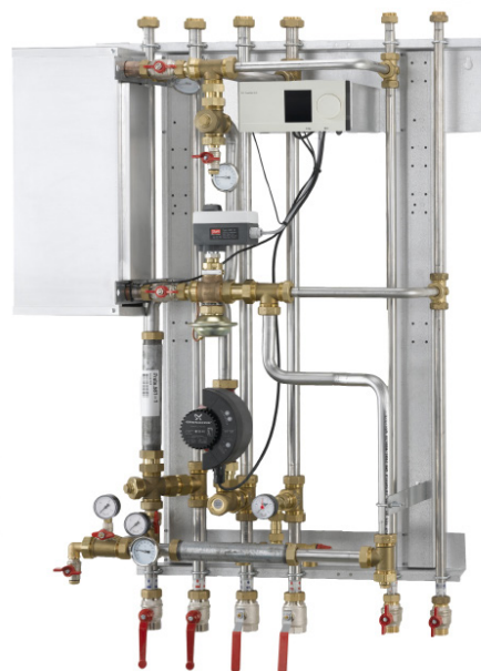
Eksempel: H 228 - automatik 1 kreds. Unitten leveres altid med rørisolering og isoleret kappe

En hensigtsmæssig rørføring og konsekvent samling med omløbere gør det nemt at servicere og montere unitten. Montage er hurtig og enkel. Unitten fastgøres på væg og da alle rør er placeret i rørbærafstand fra væg og unitten er med rør op og ned, er det muligt at etablere en pæn rørføring.