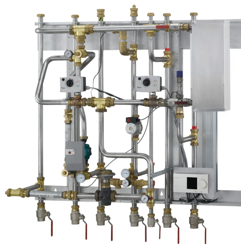
Eksempel: SW 335 - automatik 2 kredse

En hensigtsmæssig rørføring og konsekvent samling med omløbere gør det nemt at servicere og montere uniten. Montage er hurtig og enkel. Unitten fastgøres på væg og da alle rør er placeret i rørbærafstand fra væg, er det muligt at etablere en pæn rørføring.